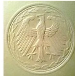
sogen. „Bundes“-Siegel (Adler mit 14 Schwingen)