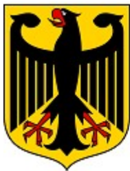
sogen. „Bundes“- Wappen

Neben dem Reichsadler gibt es noch weitere verwendete Adlersymbole: Die Uneinheitlichkeit dieser Zeichen beweist, dass die „BRD“ kein Hoheitszeichen hat, da es sich bei der „BRD“ nicht um einen Staat handelt!