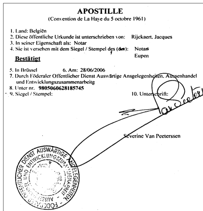
Apostille für ein belgisches Dokument

Macht davon 2–3 Kopien und lasst diese beglaubigen. Das original verwahrt Ihr Zuhause!